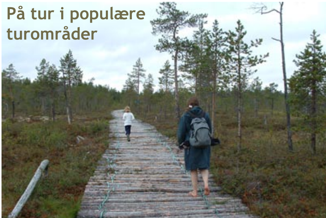
Saarimaajanka, Sør-Varanger