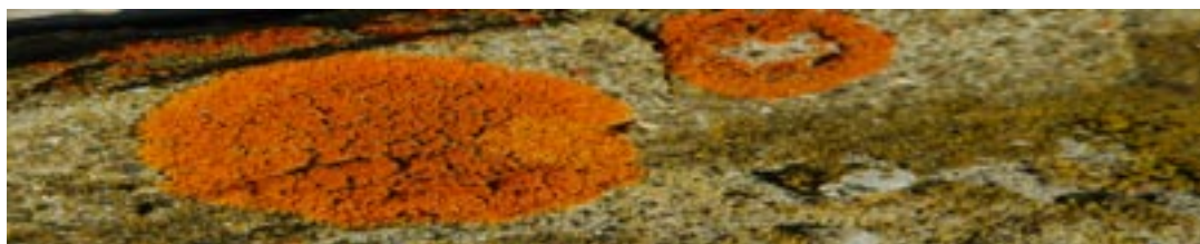
Messinglav - Foto: Morten Günther

De som er interessert i spesielle aktiviteter som terrengsykling, klatring og padling eller andre fritidsaktiviteter må søke informasjon andre steder. Dersom du skal besøke nasjonalparker, landskapsvernområder e.l. vil du som regel finne nærmere informasjon om hvilke bestemmelser som gjelder ved opplysningstavler.