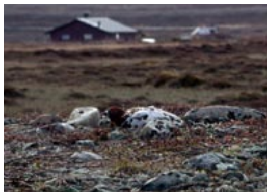
Lirype - Foto: Morten Günther