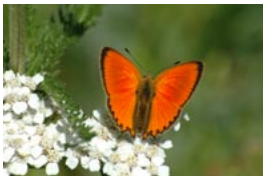
Orange gullvinge

Det er ekstra viktig at du holder deg til etablerte stier i områder der jorda er utsatt for erosjon, der det finnes sjeldne arter, eller der vegetasjonen vokser særlig langsomt. Merkelig nok er det slik at noen av de mest sensitive plantene vi har vokser på de mest utsatte stedene.