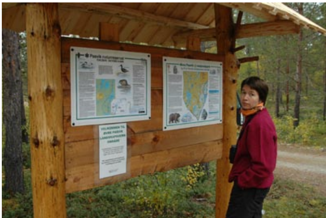
Øvre Pasvik nasjonalpark, Sør-Varanger

Store grupper vil ofte inneholde en del personer med mindre turerfaring. Det kan da være en ide å velge populære løyper hvor det er stier og campingplasser. Den norske turistforening merker 19 000 km sommerruter og 5 000 km vinterruter over det meste av landet.