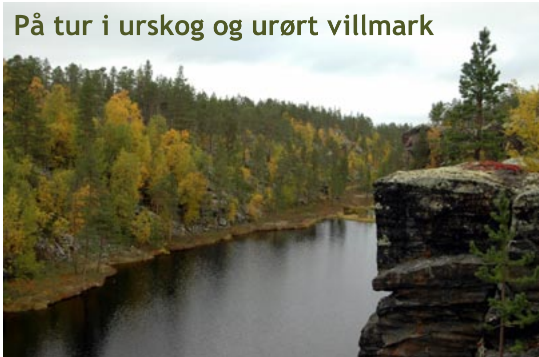
Revsaksskardet, Sør-Varanger